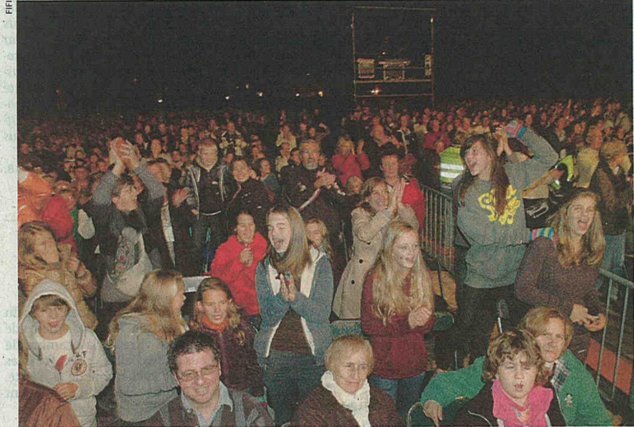
Vendredi à Waterloo, près de 10.000 personnes étaient venues chanter et danser sur les tubes d'Abba.